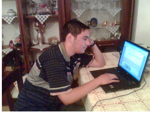
Fotoğraf 4.3: Ergenlik dönemi duygusal oluşumların gerçekleştiği süreçtir

Yeterli ve dengeli beslenme ergenlik dönemi çocuklarının sağlığı, fiziksel büyüme, duygusal, sosyal, zihinsel gelişme ve olgunlaşma açısından önemlidir. Diğer gelişim dönemlerinde olduğu gibi yeterli, düzenli, ekonomik ve sağlıklı beslenme esastır.