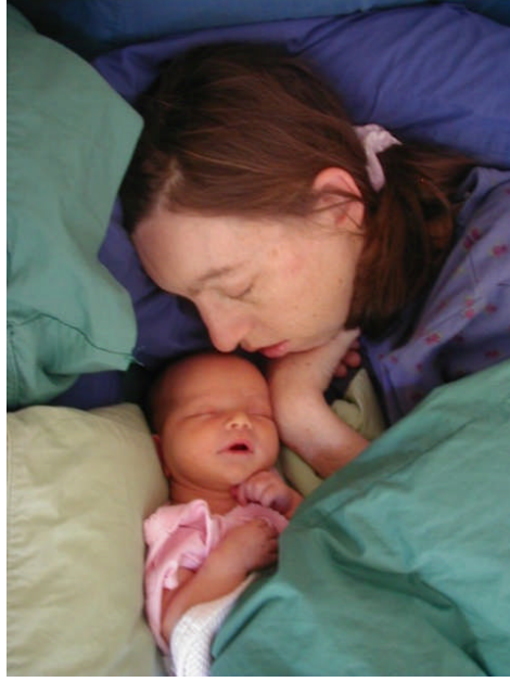
Fotoğraf 1.5: Anne sütü ile beslenme, anne bebek arasındaki duygusal bağı geliştirir