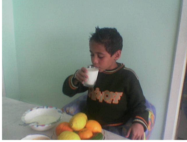
Fotoğraf 3.2: Çocuğun yeterli ve dengeli beslenmesinin göstergesi, onun büyüme ve gelişmesidir