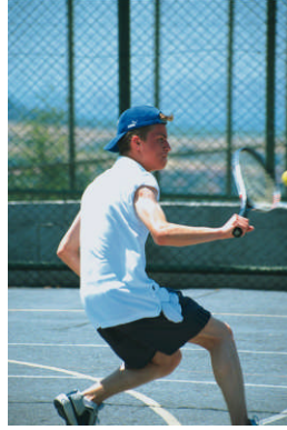
Fotoğraf 4.4: Günlük enerji ihtiyacı fiziksel aktivite ile ilgilidir

WHO (Dünya Sağlık Teşkilatı) tarafından hazırlanan listede ergenlik döneminde enerji gereksinimi aşağıdaki şekildedir.