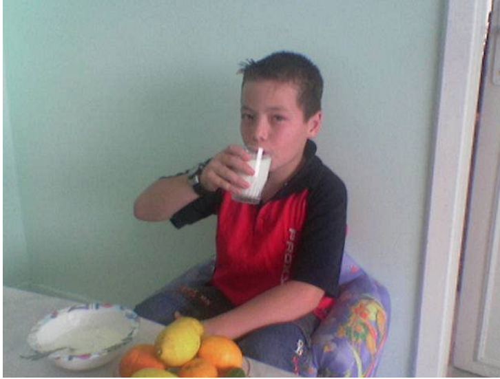
Fotoğraf 3.1: Okul çocuğunda yeterli ve dengeli beslenme önemlidir.