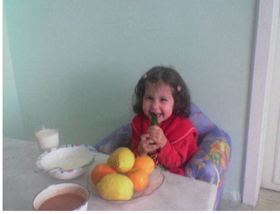
Fotoğraf 2.2: Oyun dönemi yeni beslenme alışkanlıklarının kazanıldığı dönemdir

Oyun çocuğu beslenmesinde temel ilke; büyüme ve gelişme özelliklerine uygun çeşit, miktar ve kıvamındaki besinleri seçerek karşılamak; iyi beslenme alışkanlıkları kazandırmaktır. Bu bakımdan çocukların yemek yeme alışkanlığını kazanmasında ailedeki büyüklerin özellikle de annenin tutumunun çok önemli bir yeri vardır. Çocuk büyüklerin tutumundan etkilenir. Sofrada çocuğun yanında yemeklerin hep iyi olduğu söylenmeli, huzursuzluk çıkarmamalıdır. Çocuğun şiddetle yemek istemediği yiyecekleri vermekte ısrar etmek doğru değildir. Yemek yeme konusunda çocuk ile büyükler arasında meydana gelen anlaşmazlıklar; annelerin belli saatlerde ve fazla miktarda yiyecek yedirme isteklerinden kaynaklanır. Anneler çocuklarını başka çocuklarla kıyaslarlar. Çocuklar arasında bireysel farklılıklar olduğu unutulmamalıdır. Yemek sofrası pazarlık ve savaş meydanı olmamalıdır.