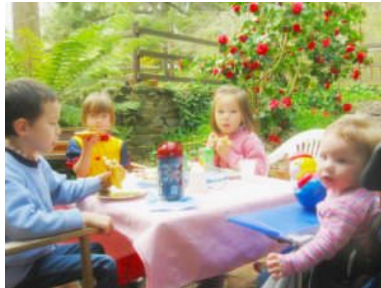
Fotoğraf 2.6: Beslenme alışkanlığı ancak iyi bir eğitimle yerleştirilebilir

Okul öncesi dönemde çocuğun tükettiği besin miktarı kadar yeni gıdalara alışması da önemlidir. Okul öncesi dönem gıda alışkanlıklarının kazanıldığı hoşlanılan ve hoşlanılmayan gıdaların belirlendiği dönemdir. Bu dönemde iyi beslenme alışkanlıklarının kazandırılması ile çocuk yaşamı boyunca doğru ve dengeli beslenebilir.