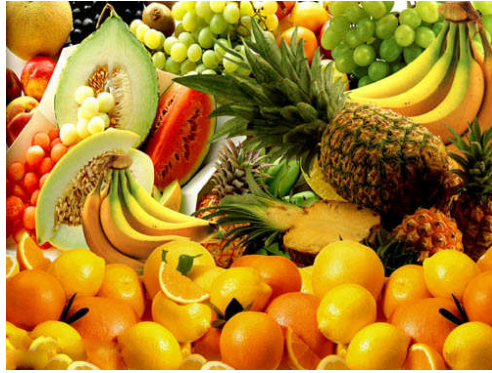
Fotoğraf 4.6: Ergenlik döneminde bütün besin grupları yeterli ve dengeli olarak günlük menüde yer almalıdır

Ergenlik döneminde gencin günlük enerji ve besin ögesi ihtiyacı yaptığı etkinliklerin derecesine ve süresine göre farklılık gösterir. Gençlerin cinsiyetlerine göre de beslenme ihtiyaçları farklılaşır. O nedenle günlük menü planlarken bu durum dikkate alınmalıdır. Ortalama olarak günlük menüde: 2.5 porsiyon süt ve türevleri; 2-2.5 porsiyon et yumurta, kuru baklagil; 3-4 porsiyon sebze ve meyveler; 6-8 porsiyon tahıl ve türevleri (Kızlarda daha az olmalıdır.) yer almalıdır.