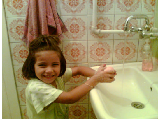
Fotoğraf 2.7: Yemek öncesi ve sonrası kişisel temizlik öğretilmelidir