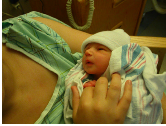
Fotoğraf 1.2: Doğal beslenme, Altıncı aya kadar bebek emzirilmelidir