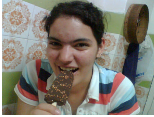
Fotoğraf 4.5: Ergenlik döneminde bol kalorili yiyecekler sevilir ve tercih edilirken aynı zamanda zayıf kalmak istenir

Ailede ve okulda beslenme eğitimi ve iyi alışkanlıklar ergenlik döneminde de önemlidir. Bol kalorili beslenme alışkanlığı yerine proteinli yiyeceklere özendirilmelidir. Güzel olmanın aşırı zayıf olmak anlamına gelmediği açıklanmalıdır. Ergenlik döneminde gençlere beslenme, temizlik, bakım ve düzenli yaşamın dış görünüşü de iyileştirdiği benimsetilmelidir. Örneğin cilt sağlığı ve güzelliğinde, iskelet ve dişlerin büyümesi ve sağlığında, normal ağırlığın korunmasında, kas gelişiminde fiziksel ve zihinsel yönden güçlü olmada besin öğelerinin etkileri ve önemi vurgulanmalıdır.