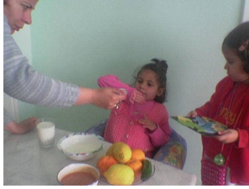
Resim 2.9: Yemek seçen çocuk, yemediği yemekler için zorlanmamalıdır

Çocuğun iyi davranışlarda bulunduğu zamanlarda şeker, çikolata ve benzeri şeylerle ödüllendirilmesi bazı besinleri reddetmesine neden olacak ve hep aynı şeyleri aynı yöntemle yemek isteyecektir.