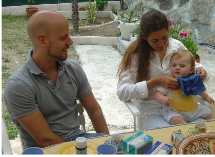
Fotoğraf 1.4: Baba da bebeğin temel ihtiyaçlarını karşılamada yer almalıdır.